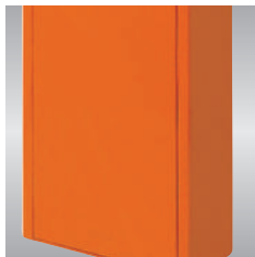
■ Cuerpo barrera autoportante