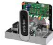
Tarjeta electrónica E 720 integrada Caract. técnicas en la pág. 125