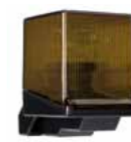
Destellador Faalight 24 Vdc