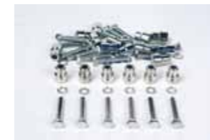
Paquete de fijaciones con fijación mecánica 18 pzas.