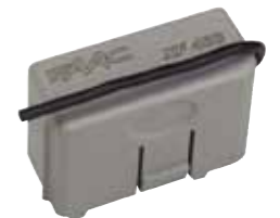
Receptor XF433 Mhz Receptor XF868 Mhz