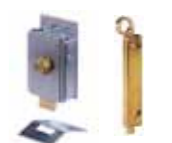
Otros accesorios pág. 148