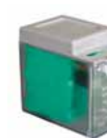
Kit batería de emergencia XBAT 24 (no compatible con E 124)